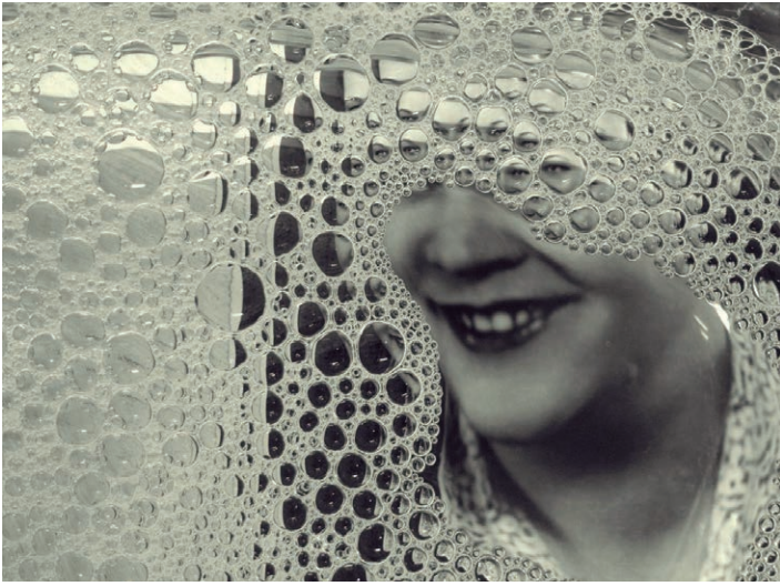
Patricio Reig. Espumas #100 . Lamnda s/ Fujicolor Crystal Archive paper. 100 x 133 cm. 2010.