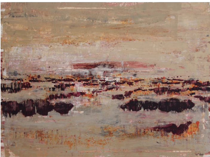
Pere de Ribot. s/t. Oli sobre tela. 97 x 130 cm. 2012.