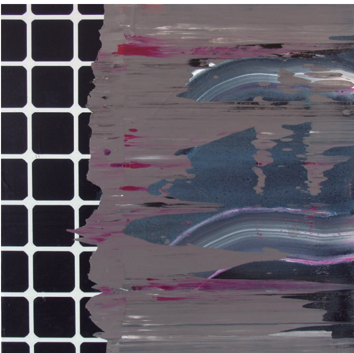
Joan Cabrer. Paralepipedamente III . Acrílic sobre tela. 50 x 50 cm. 2014.