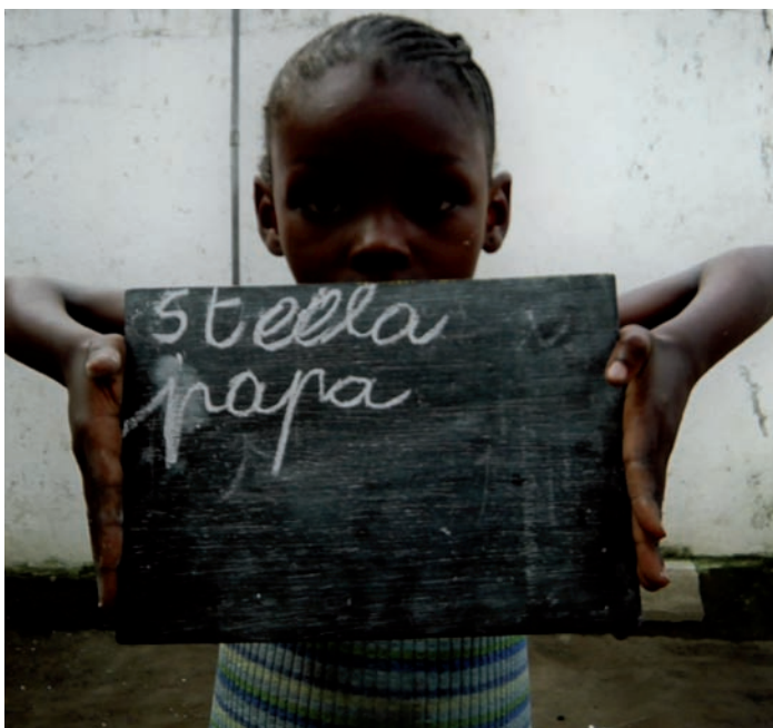
José Ramón Bas. Sin título (Serie Bango). Fotografía retocada digitalmente. 25 x 25 cm. 2011.