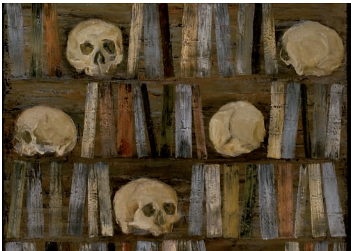
Carles Gabarró. Oli sobre tela. 180 x 150 cm. 2006.(Detall)