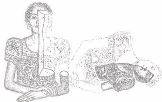
Amparo Sard. "La otra nº2". Papel perforado. 1,5 x 2 m. 2013.