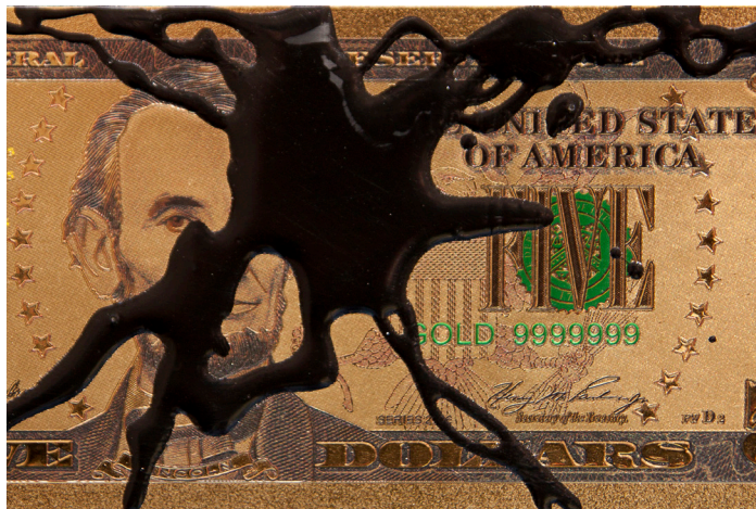
Detalle de reproducció de billete de 5 dòlars de oro de 24 K manchado de resina de polièster