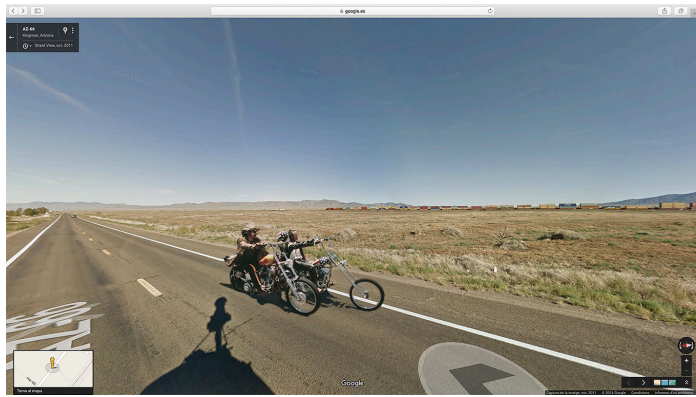
Easy Rider/AZ-66. Kingman. Arizona. De la sèrie Road Moview