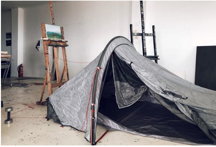
Estudi de Marco Noris.