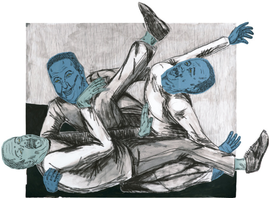
Susanna Inglada. Ojos de oro. 200 x 150 cm (detall). Técnica mixta sobre paper. 2017.