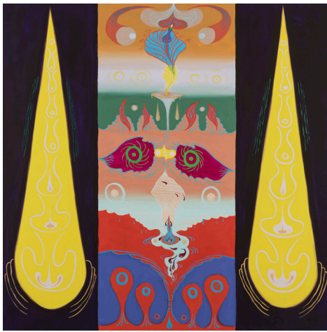
Aldo Urbano. Brotar arrollador. 190 x 190 cm. Oli sobre tela. 2018.