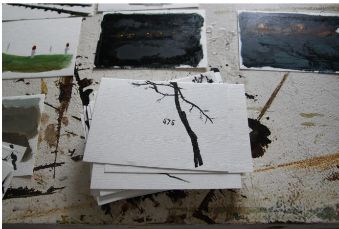
Foto del dibujo creado en la muga 476.