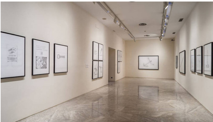
Avelino Sala. "Darkness at noon". Vista de la exposició en el Museo de Bellas Artes de Asturias. 2014.