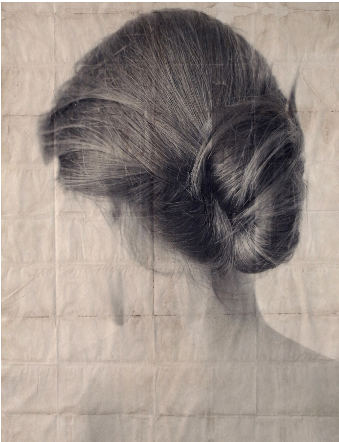
Patricio Reig. "Guardami". Fotografia analògica s/ paper virat. 140x100 cm. 2014.