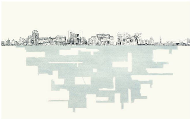
Yamandú Canosa, "Ciudad iceberg". Carbón y óleo sobre papel, 61,5 x 99,5 cm. 2019.