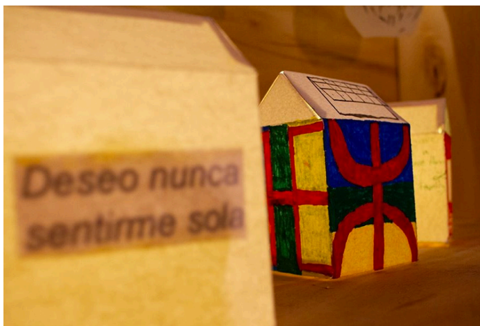
Detalle de las casas iluminadas realizadas en el proyecto "Mar de Fuga, Mar de Cura".