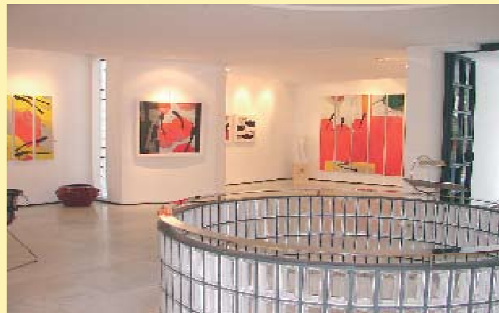
Galerie Venise Cadre Casablanca, El Marroc Febrer 2007

Tourab fue vendida íntegramente. De hecho, antes de inaugurar 10 piezas ya tenían propietario: entre ellos el Palacio Real. Nos congratulamos, por consiguiente, de este nuevo acontecimiento: el regreso del artista pródigo.