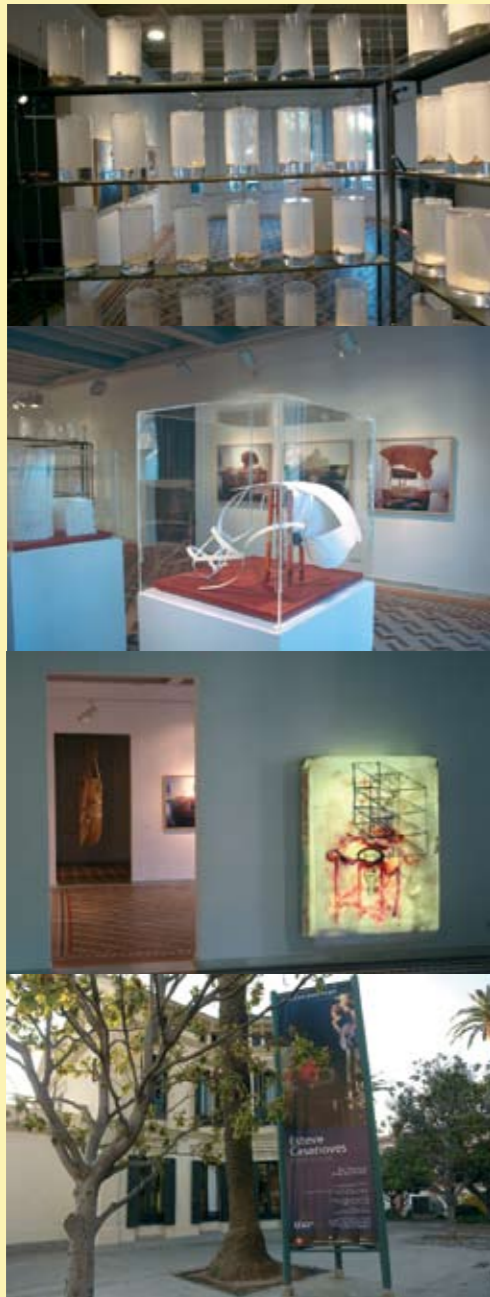
Torre Muntades El Prat de Llobregat Abril 2007

A la mateixa sala, el dia 10 de maig, a les 19.00 hores, es durà a terme una xerrada amb l'autor i es presentarà el catàleg de l'exposició.