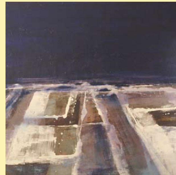
Alicia Ibarra: "Paisaje holandés con canales", 2005. Oli sobre tela, 130 x 140.

Tots els paisatges d'aquesta autora es nutreixen d'una experiència abstracta i, poc a poc, s'apropen als límits de la figuració.